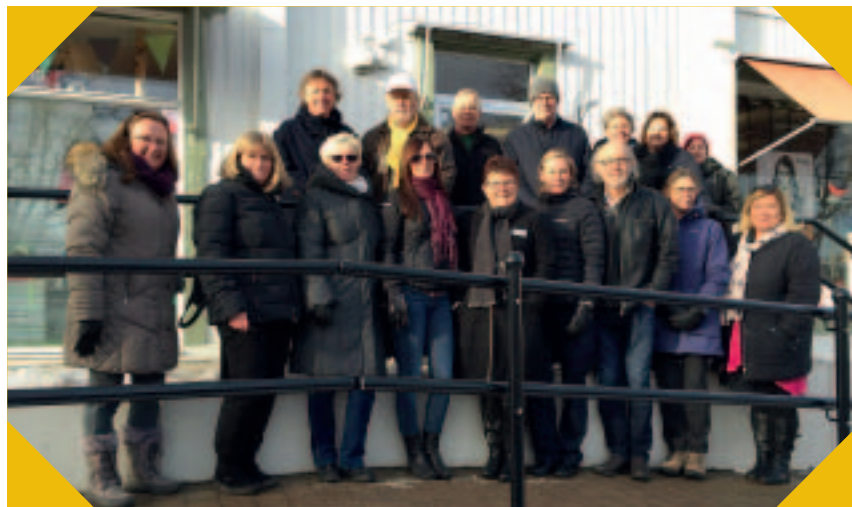
Stadsvandring i Torsby tillsammans med organisationen "Svenska Stadskårnor"