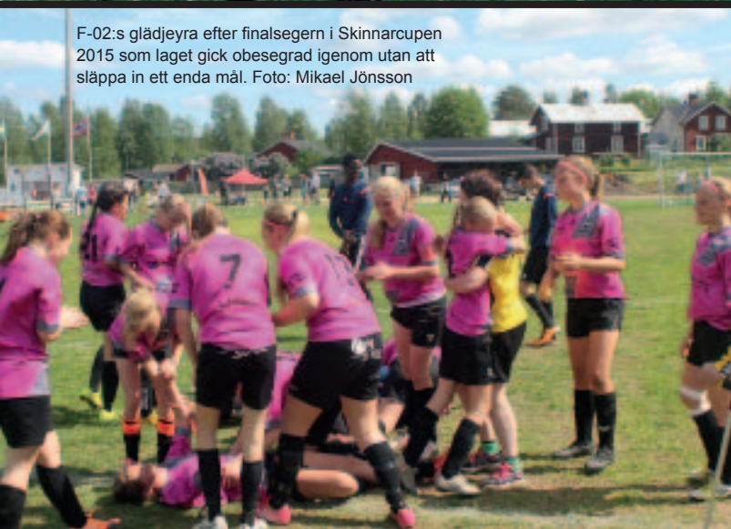
F-02:s glädjeyra efter finalsegern i Skinnarcupen 2015 som laget gick obeseegrad igenom utan att släppa in ett enda mål.