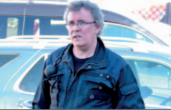
Skorstensfejarmästare Jan Olsson