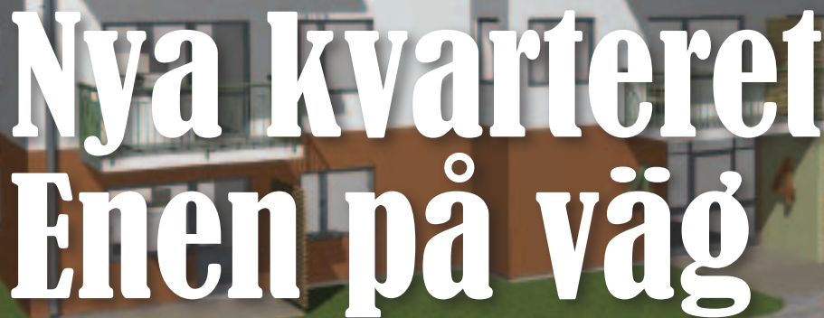
Illustration: Klara arkitekter

Vi på Torsby Bostäder tror på en positiv utveckling av bostadsmarknaden i Torsby. Därför byggs lägenhetshus för fullt i det nya kvarteret Enen i Torsby. Huset ska ligga mellan bostadsområdet Aspen och Alstigen, nära till centrum och nära till Valberget. Planen är ett hus till att börja med, men det finns plats för flera.