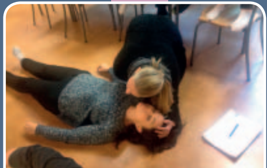
Studerande visar hur man kontrollerar fria luftvägar och andning